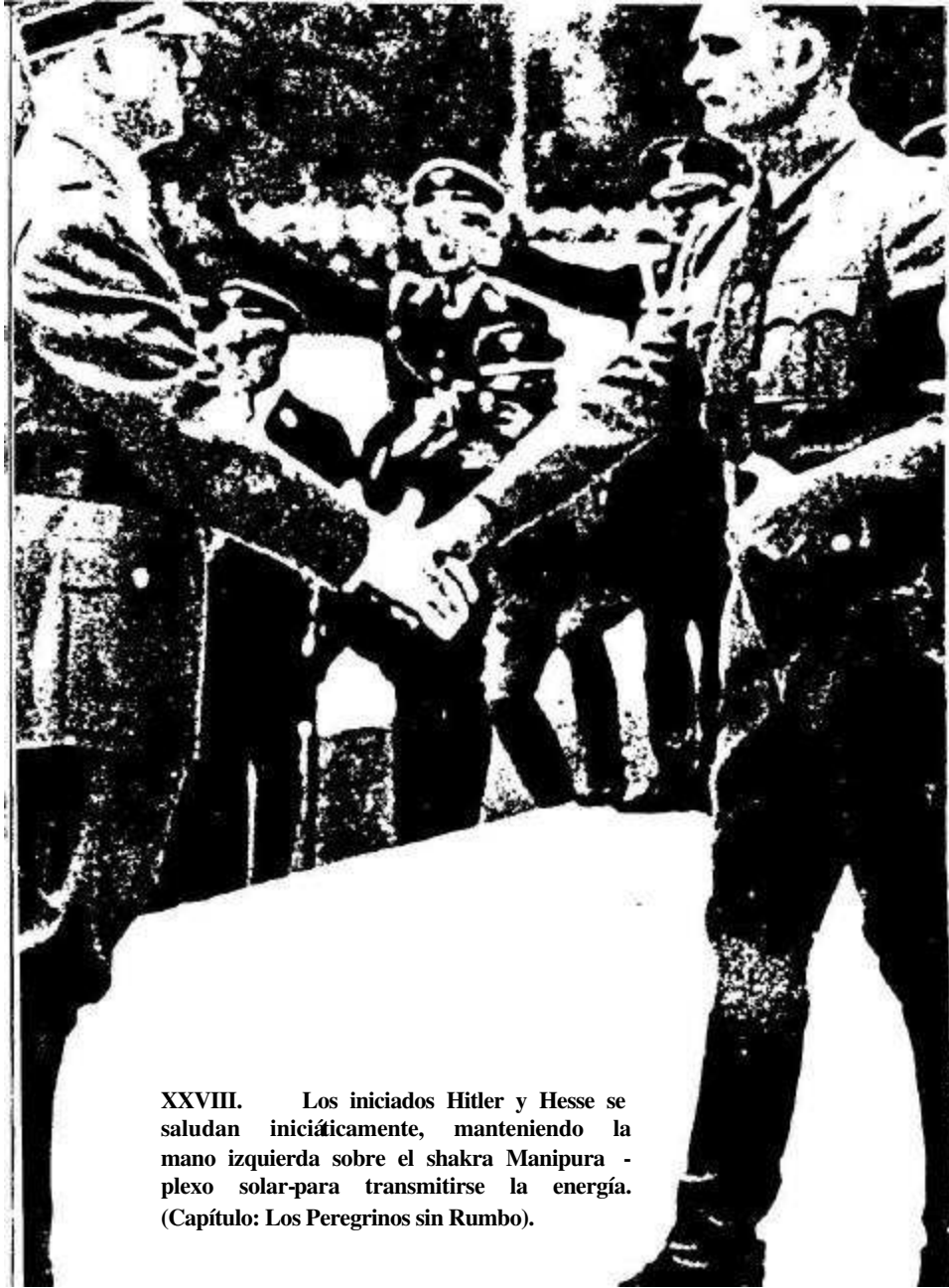
XXVIII. Los iniciados Hitler y Hesse se saludan iniciáticamente, manteniendo la mano izquierda sobre el shakra Manipura - plexo solar-para transmitirse la energía. (Capítulo: Los Peregrinos sin Rumbo).