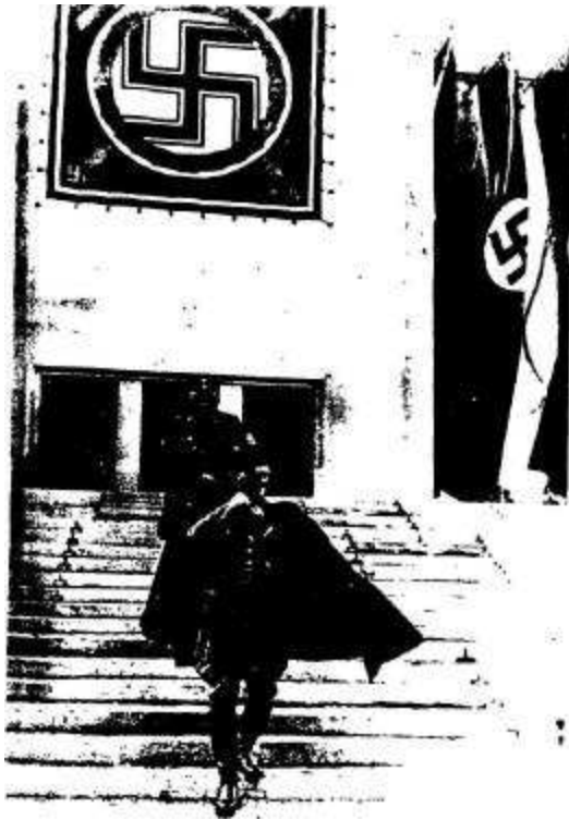
XXVII Hitler, el iniciado, en los mágicos Congresos de Nuremberg (Capítulo Hitler Gran Sacerdote de Occidente)