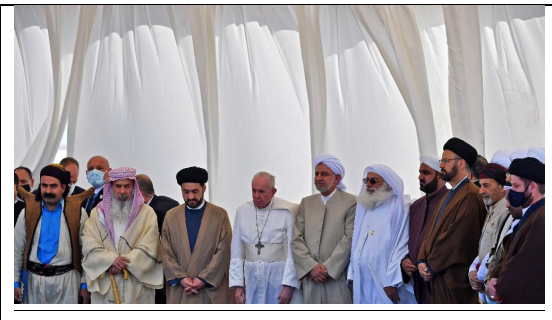
Pope in ceremony at Ur March 2021

In ancient Sumer there were two gods: Baal, the god of war and the elements, and Ishtar, the goddess of fertility. Ishtar made the land fertile in crops, as well as providing pleasure and love. And around it money was developed, because the first coins were used so that men could enjoy Ishtar. The men entered the temple and offered their abundant crops to the priests. The priests kept the crops in warehouses for times of famine, an insurance against winter, when food was scarce, and against pests and droughts. In exchange for their goods, the priests gave money to the farmers. What could be obtained with that coin? Sex. The Greek historian Herodotus described how it worked: "Every woman in the country went once in her life to the temple of love, where she had [...] relations with any stranger [...]."