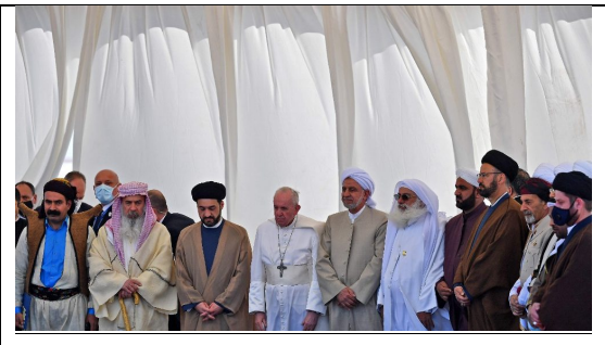
Pope in ceremony at Ur Marzo 2021