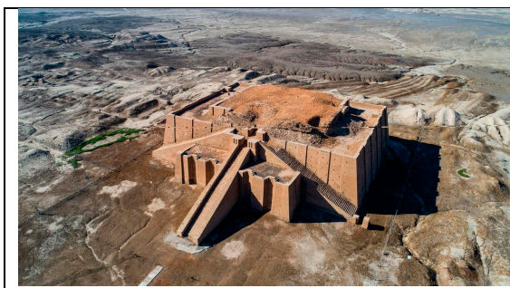
Templo en Ur (Iraq)