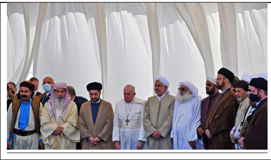
Papa en ceremonia en Ur, Marzo 2021