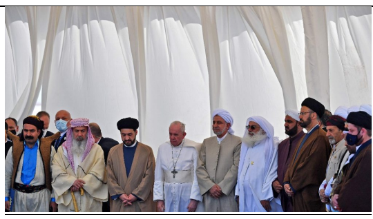
Papa en ceremonia en Ur, Marzo 2021