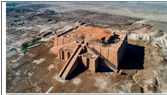
Temple at Ur (Irak)

Energy, evolution, involution, sex and money