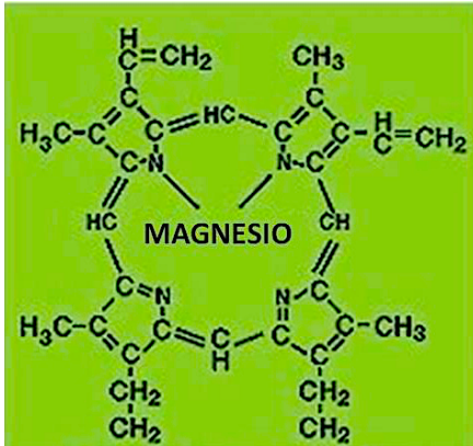
Green = Chlorofyll

Amarillo/Naranja/Rojo = Nubes de Calcio en el Sol