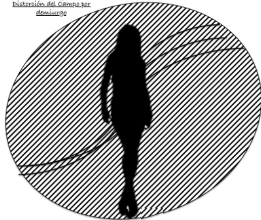
Field distortion by demiurge Distorsión del Campo por demiurgo

This is the sole purpose and finality of any "procedure" or "ritual": Transcending, in increasing the breadth of our consciousness until it reaches its full and real "dimension". The "results" or "consequences" of such "procedures", "techniques" or "rites" will be relative to the greater or lesser "alignment" with a "greater order" by the individual elements and how to a greater or lesser degree they participate in that "Higher Order".