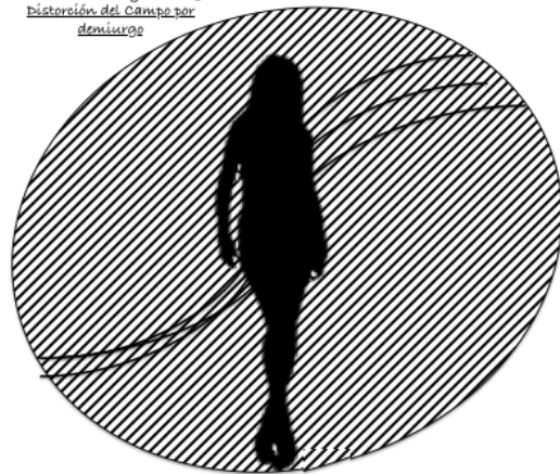
Field distortion by demiurge Distorsión del Campo por demiurge

La única finalidad y propósito, al final, no es sino servir, a la única finalidad y propósito de la existencia de los seres vivos: El acrecentamiento de la "Conciencia de Ser" (esto ya involucra todo y con un sentido de realidad trascendental). Éste es el único propósito y finalidad de todo "procedimiento" o "ritual": el Trascender, en acrecentar la amplitud de nuestras conciencias hasta que alcancen su completa y real "dimensión". Los "resultados" o